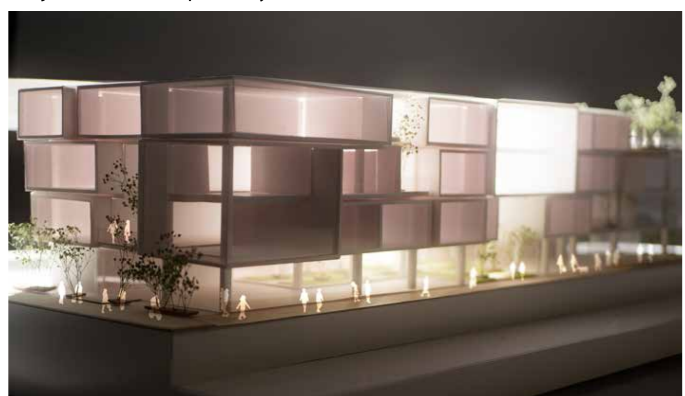
Diploma 1 Workplace in suburb