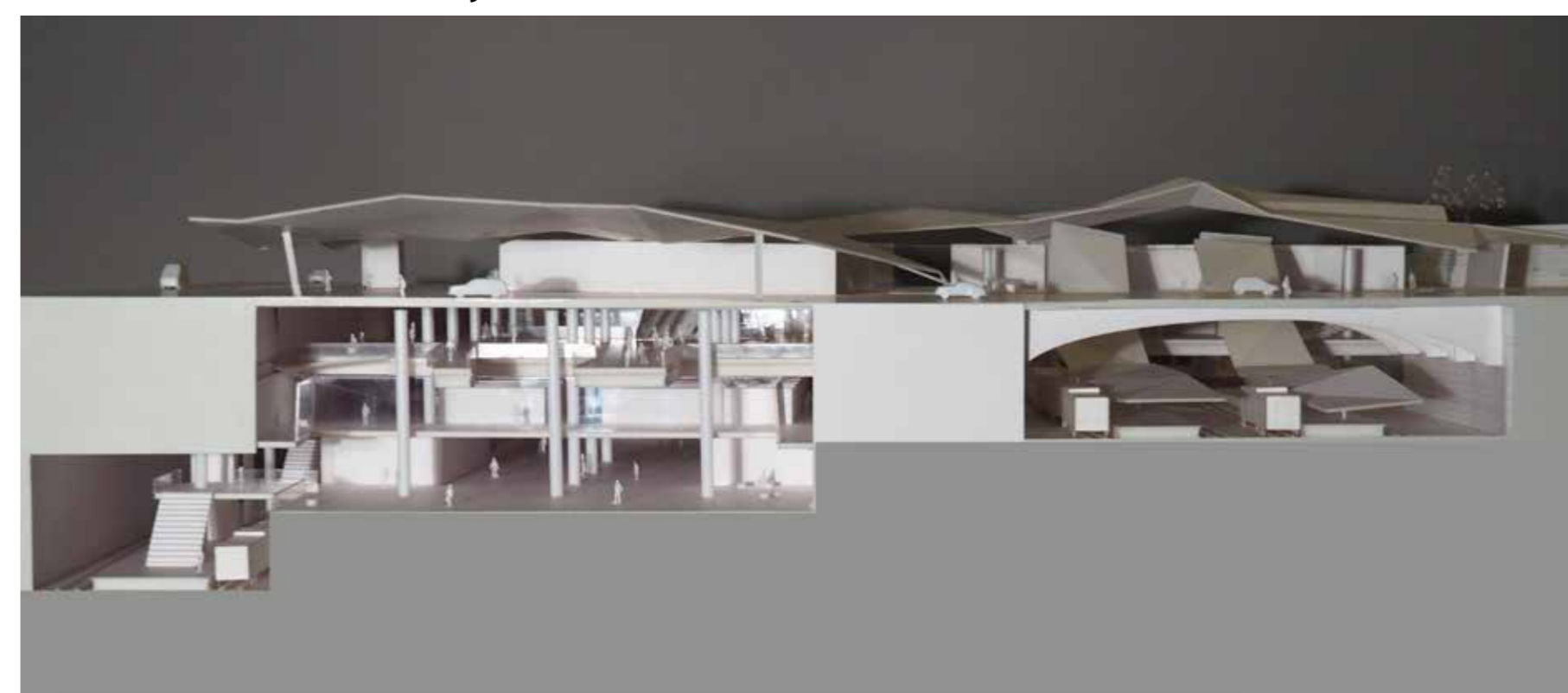
Diploma 3 Station in historical landscape