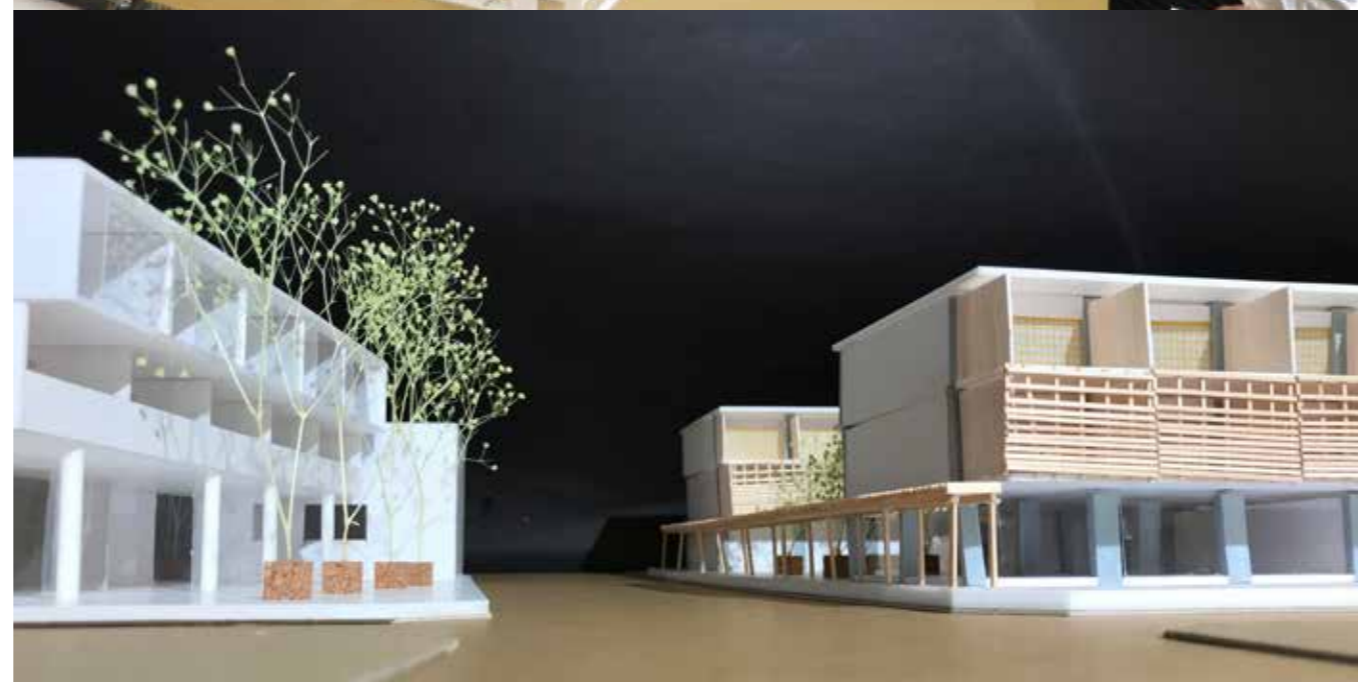
Project 2 Urawa-misono housing design guideline