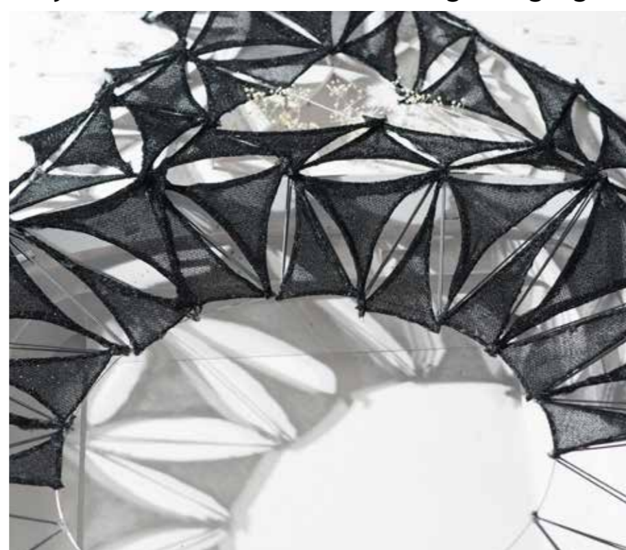
Diploma 2 Stadium