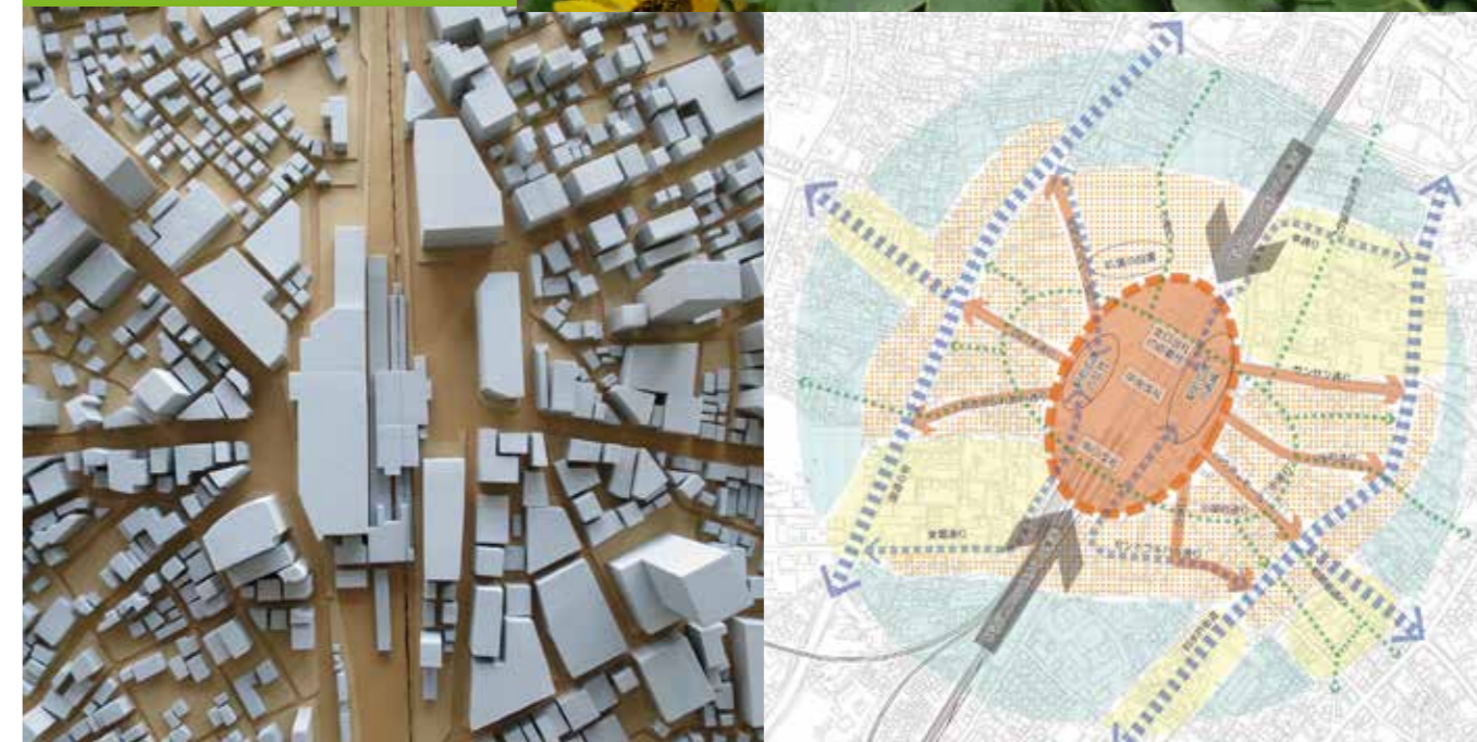
Project 3 Kashiwa central