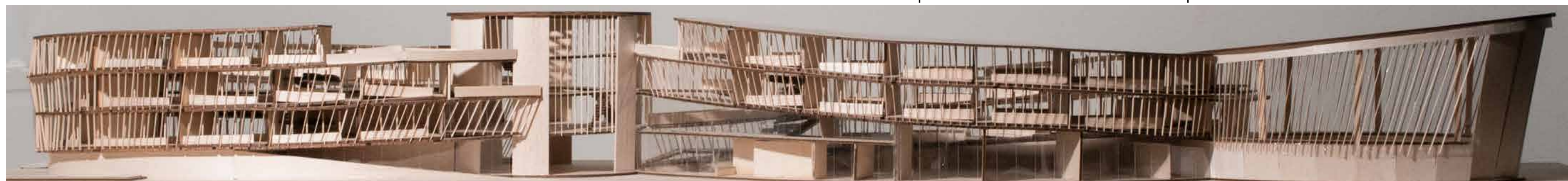
Diploma 4 School complex