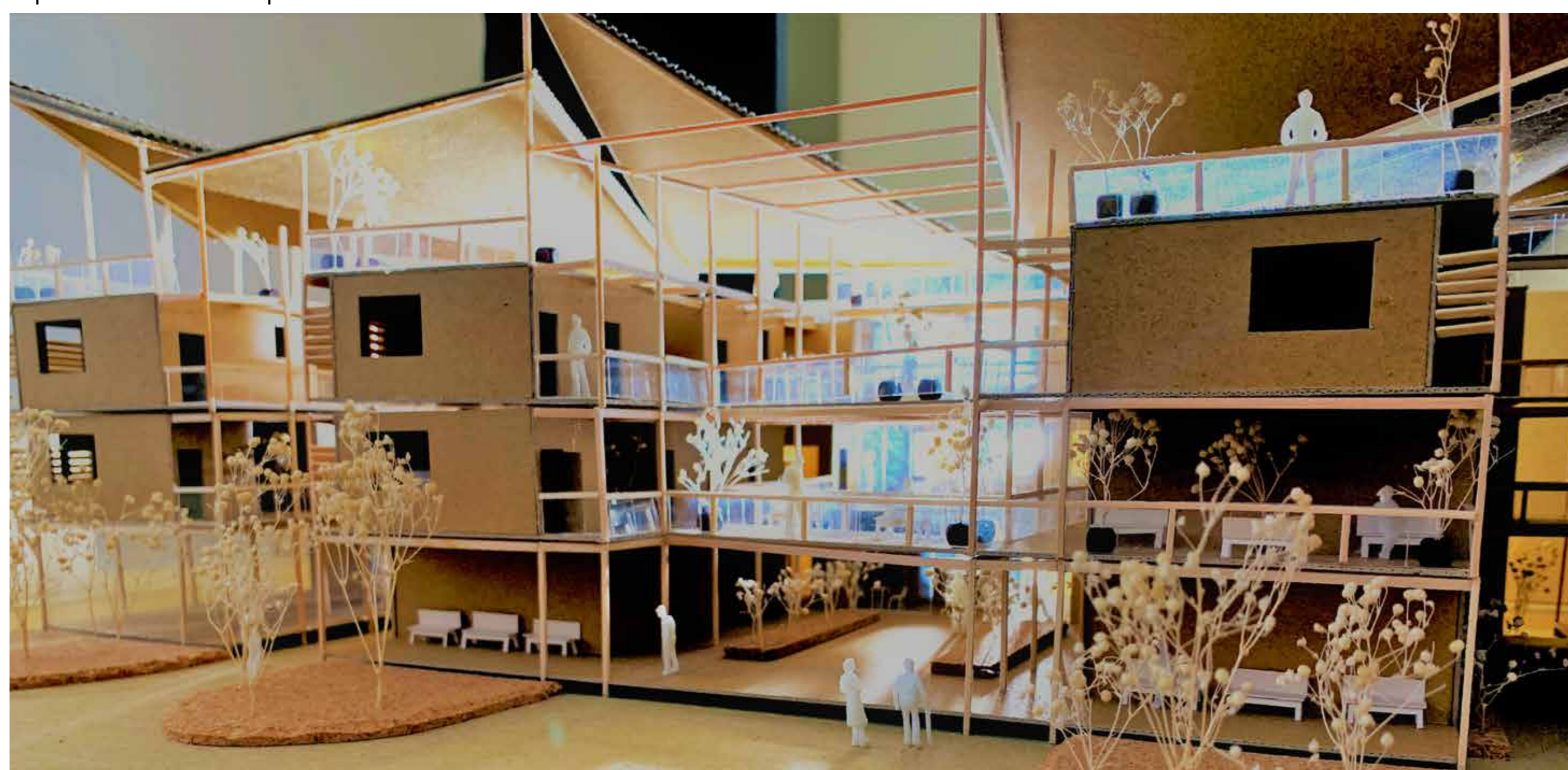
Diploma 5 Care home