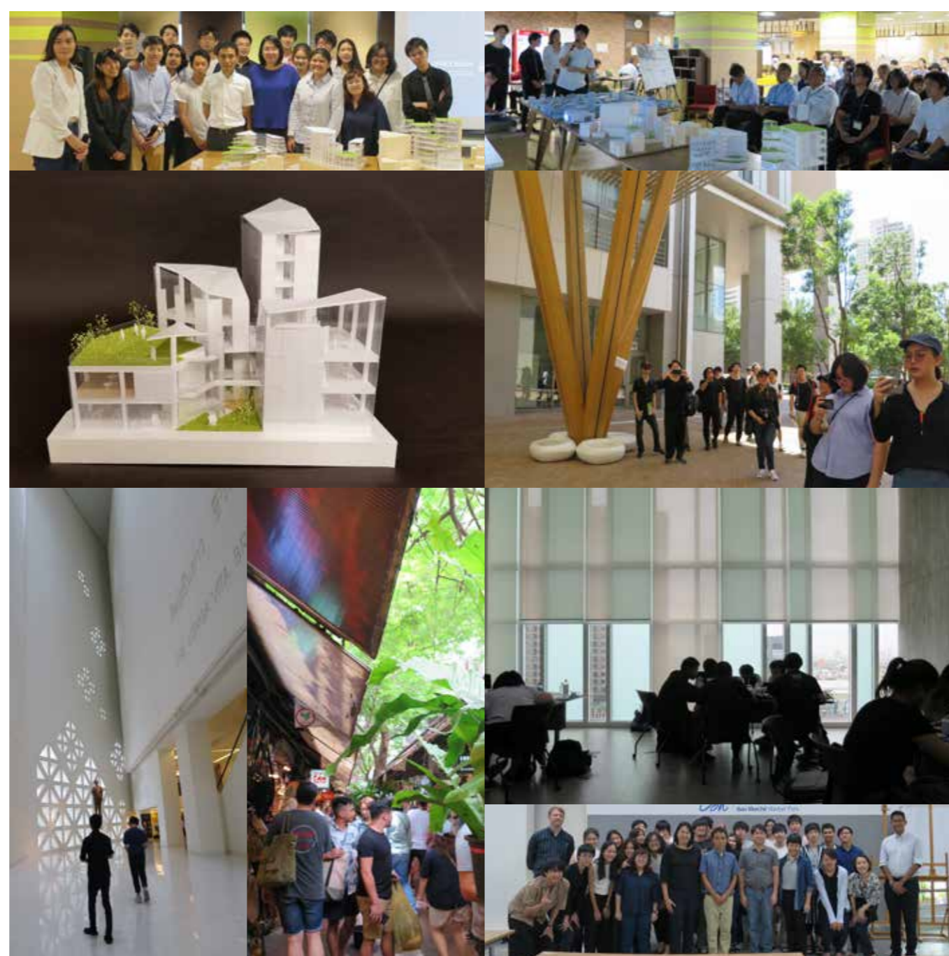
Workshops at Kashiwa, Chiba Prefecture, and Bangkok, Thailand

学部4年：秋元優介・池谷星斗・加藤雅大・加藤義公・豊嶋達也・沼百合子・松本宗磨・渡邊丞