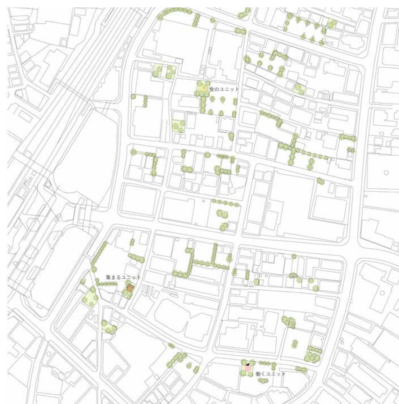
Diploma 6 Small urbanism