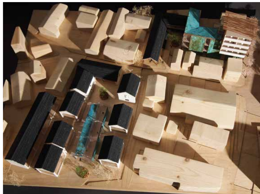
Conservation 歴史的空間を今に生かす