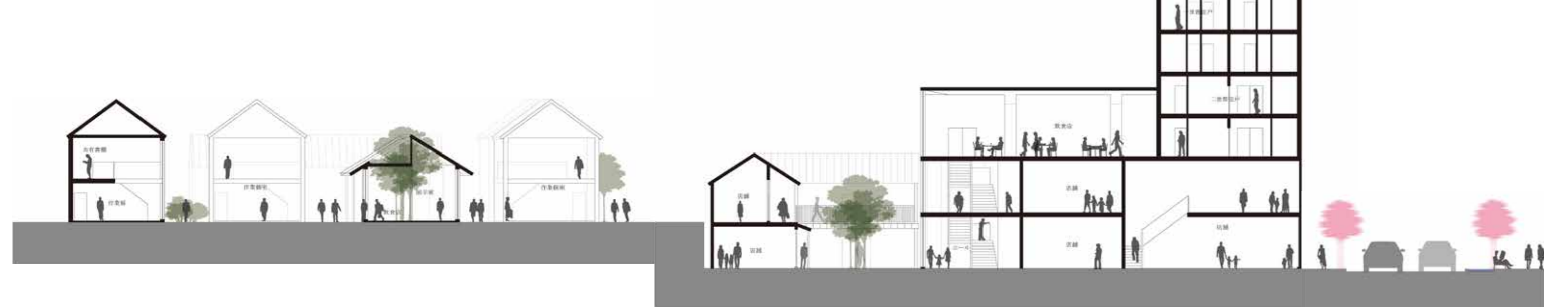
Craftmen village 伝統工芸センター