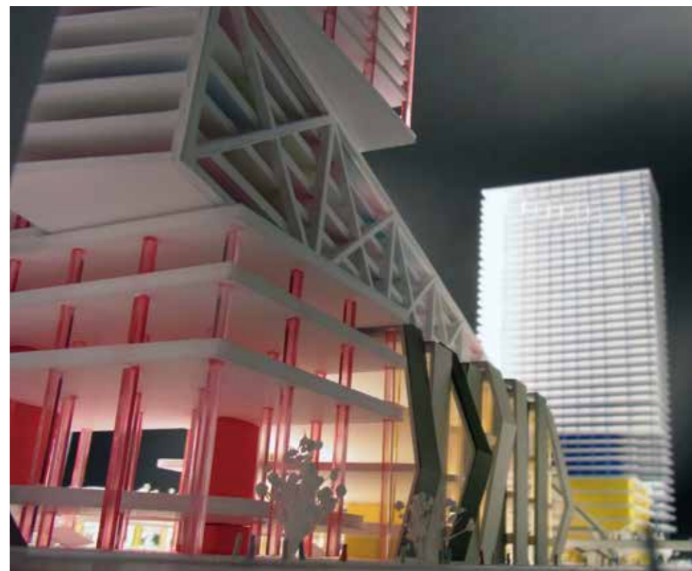
Station redevelopment 都心駅再開発