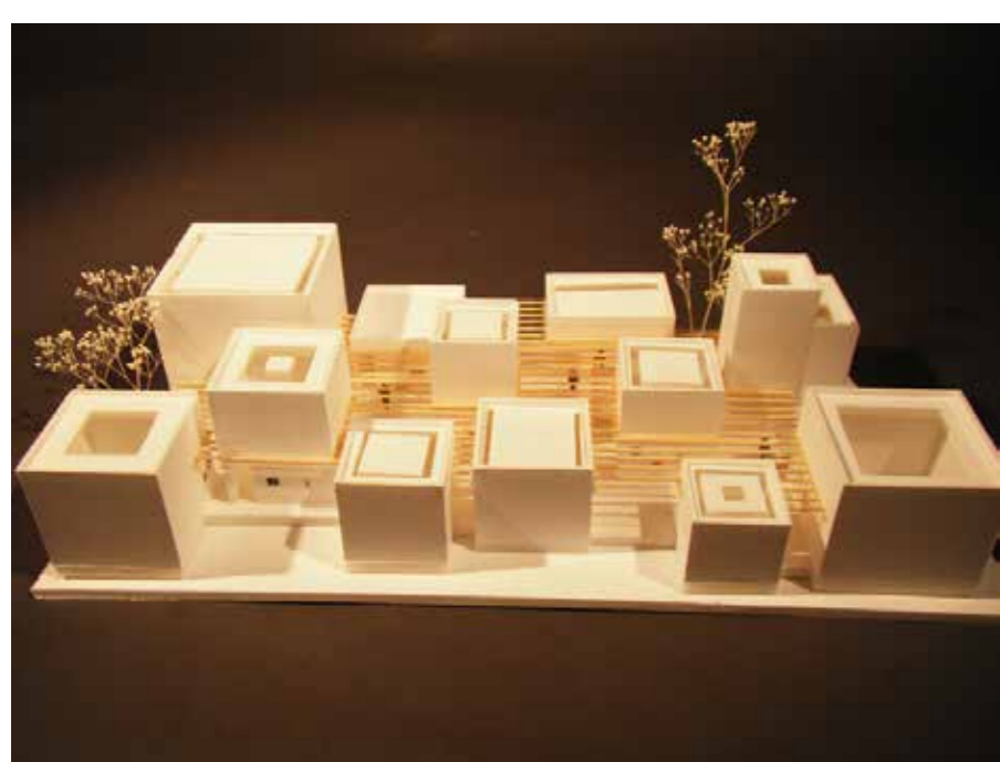
Library & cafe ブックカフェ