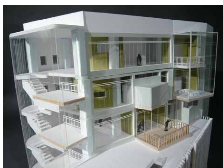
Renovation デザインスクール