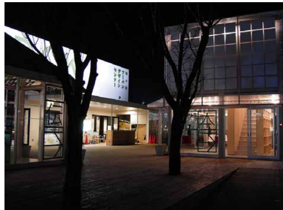
Small public space 小さな公共空間