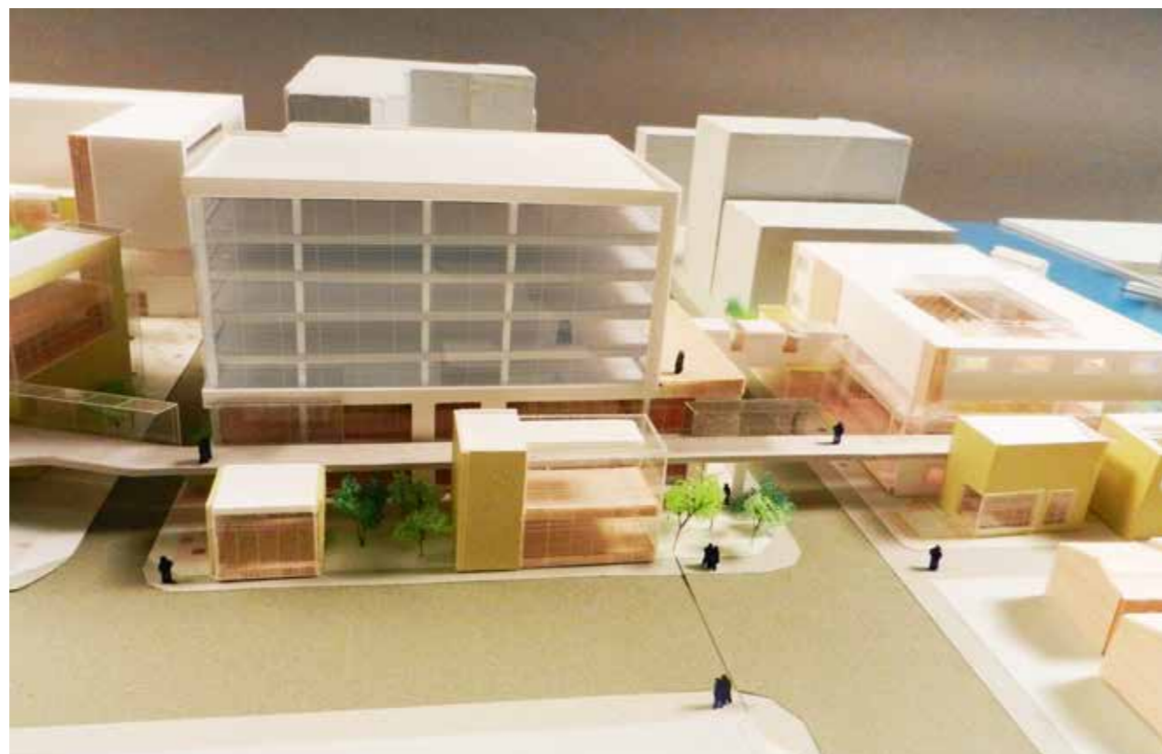
Third places 都市のサードプレイス