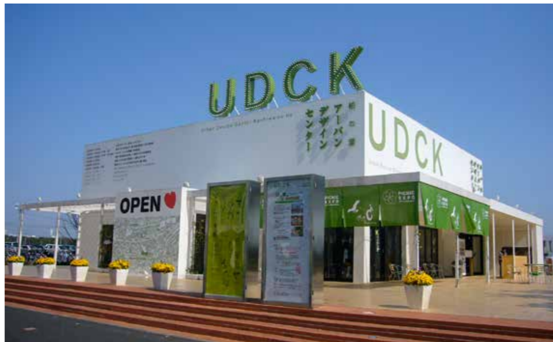
Urban design centers 組織と拠点