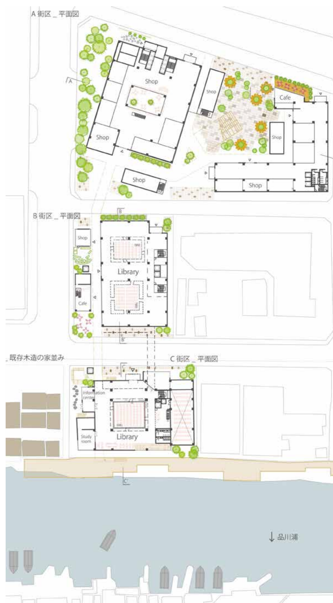
Canal zoning 運河沿い空間利用と建築