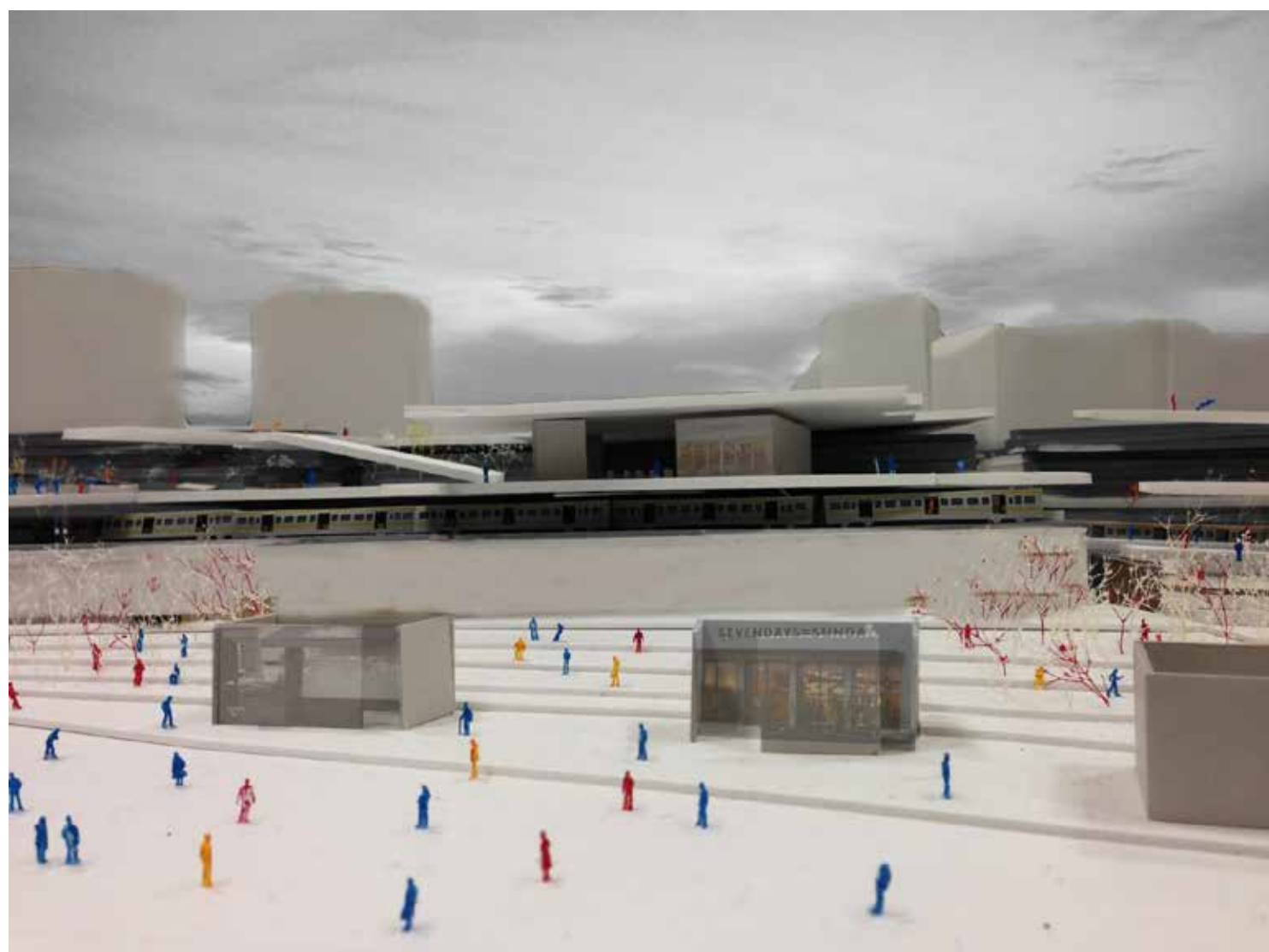
谷間の駅と地形の復元 JR四ツ谷駅の建替計画 Station in the valley, JR Yotsuya Station