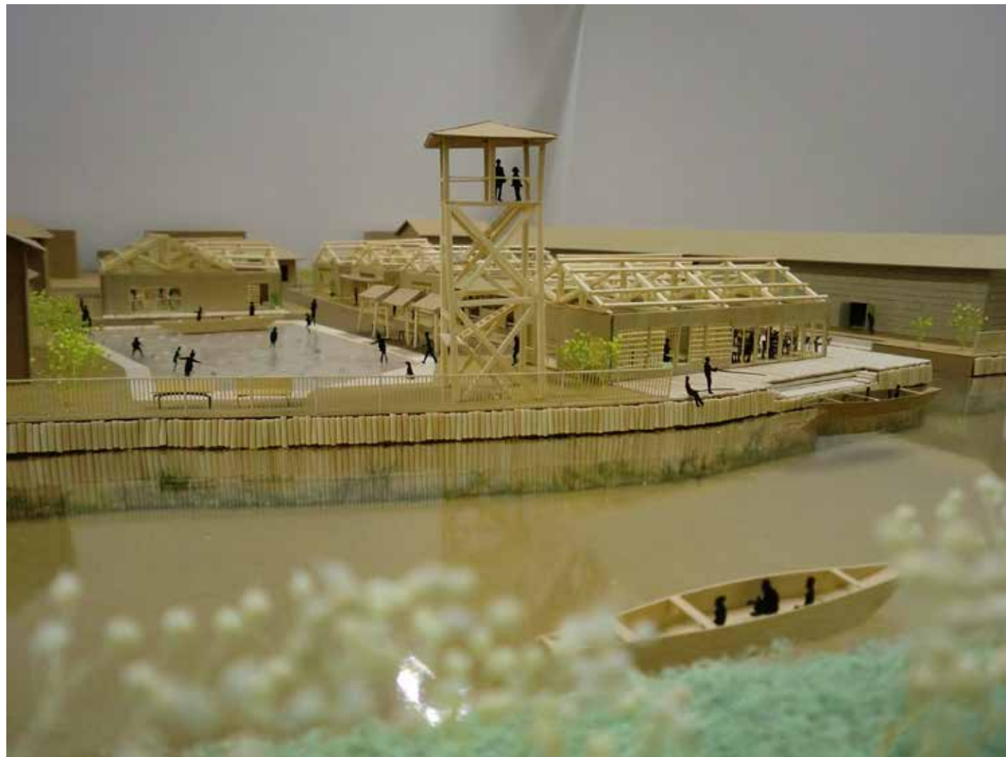
茨城県潮来市 水郷復元計画 Restoration of canals in Itako, Ibaraki Pref.