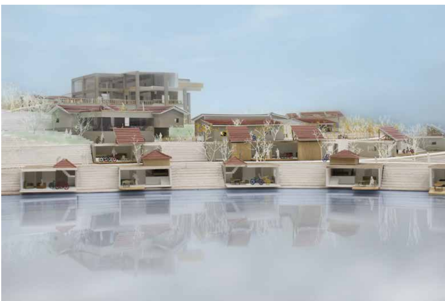
地方公立自然公園のリノベーション Renovation of a prefectural park