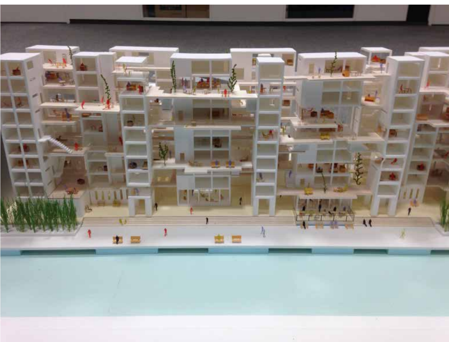
運河沿いのコレクティブハウス Housing along the canal