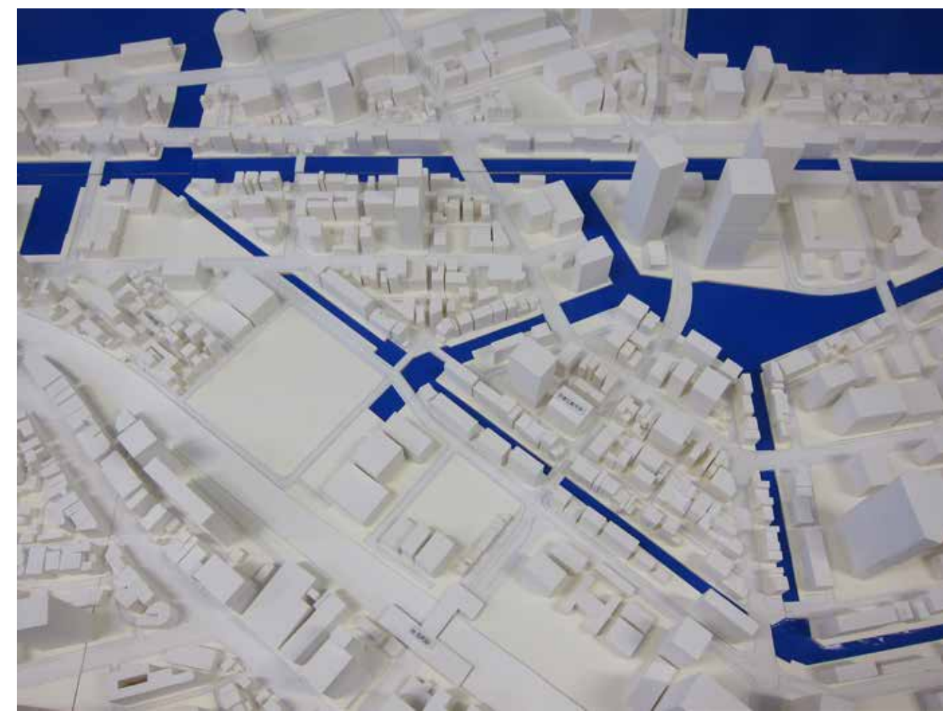
2013年度研究室プロジェクト 水辺の都市 東京都港区芝浦海岸地区の模型製作と現地調査 Lab. Project 2013 Urban tissue of Tokyo Waterfront in Shibaura, Minato City