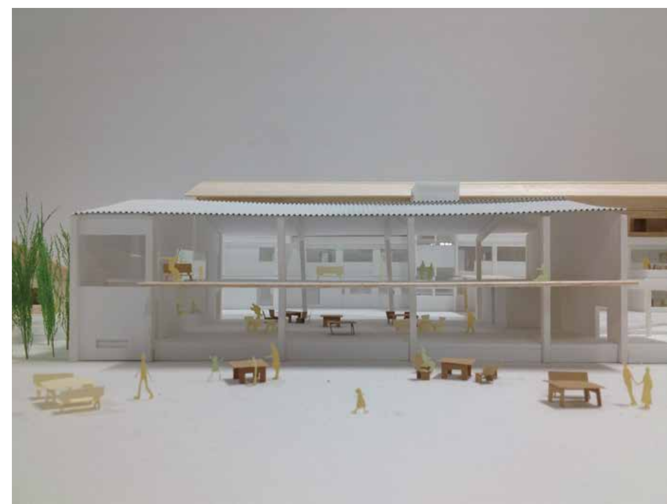
首都圏中山間地域の廃校コンバージョン Conversion of a school