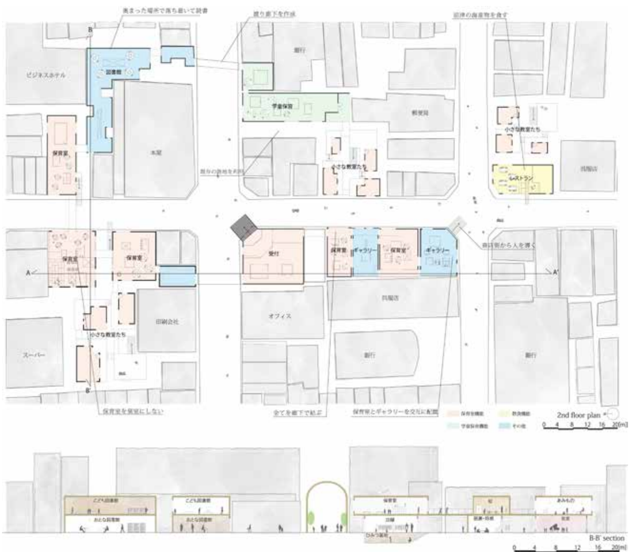
全蓋式アーケード 商店街から交流空間へ Shopping Galleria as communication place