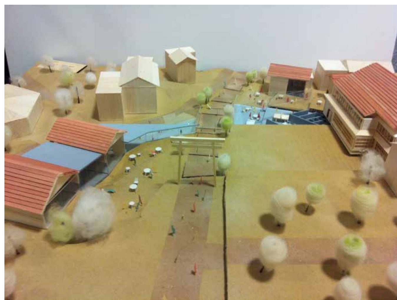
神社境内木造民家のコンバージョン Conversion of a timber house in the shrine site